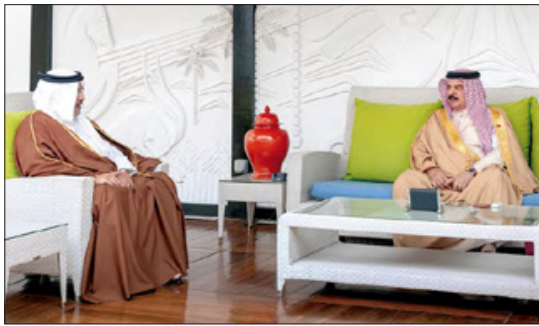
جلالة الملك خلال اجتماعه مع ولي العهد رئيس مجلس الوزراء