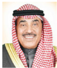
رئيس مجلس الوزراء الكويتي

مسيرتها الظاهرة المباركة وما تشهده من تطوير مستمر في منظومات الأسلحة والمنشآت العسكرية. وأشاد حفظه الله بافتتاح مركز محمد بن خليفة بن سلمان آل خليفة التخصصي للقلب، حيث إنه يمثل أحد المنجزات الطبية النوعية لتوفير أرقى