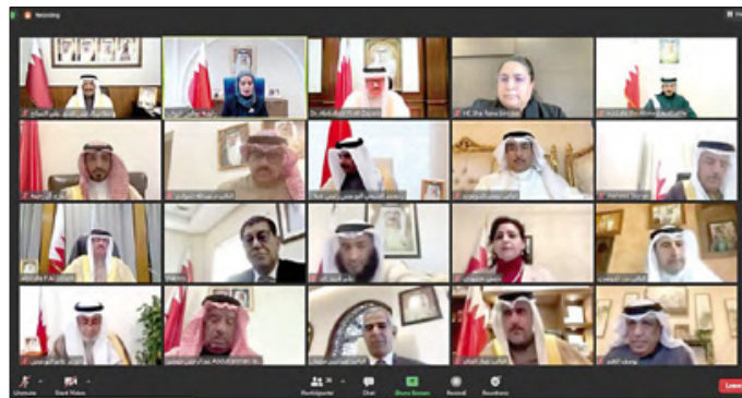
وزير الخارجية خلال لقائه السلطة التشريعية

وأمنها وسلامة إقليمها، من خلال انتهاك مياها الإقليمية دون مراعاة للقانون الدولي». وذكر أن وزارة الخارجية قامت، بتاريخ 5 فبراير 2021، بإرسال خطاب إلى الأمين العام لمجلس التعاون، أوضحت فيه أن قطر لم تستجب لدعوة التي وجهتها وزارة الخارجية لبدء المباحثات الثنائية بين الجانبين حيال القضايا والموضوعات المعلقة بين البلدين؛ تفعيلاً لما نص عليه بيان الغلا، وأنه تم التأكيد على أن البحرين سوف تنتظر الرد على الدعوة للقاء الثنائي، والذي هو رغبة أهل البحرين، والتي تطالقت مع ما ورد في بيان الغلا.