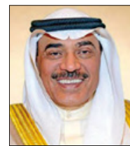
الشيخ صباح الصباح

جرى اتصال هاتفي بين صاحب السمو الملكي الأمير سلمان بن حمد ولي العهد رئيس مجلس الوزراء وأخيه سمو الشيخ صباح خالد الحمد الصباح رئيس مجلس الوزراء بدولة الكويت الشقيقة. وخلال الاتصال، أكد صاحب السمو الملكي ولي العهد رئيس مجلس الوزراء على عمق الروابط الأخوية المتينة التي تجمع بين مملكة البحرين ودولة الكويت، مستعرضاً تقدمها على مختلف الصعد بما يعود بالنفع على البلدين والشعبين الشقيقين.