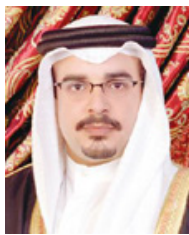
ولي العهد رئيس الوزراء