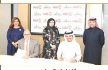
أثناء توقيع الشراكة بين الجانبين

أعلن بنك البحرين الوطني (NBB) عن تعاونه مع بنك الإسكان لتدشين منتج تمويل الرهن العقاري المشترك خلال شهر يناير 2021، إذ سيخدم المستفيدين من خدمات التمويل الإسكاني التابعة لوزارة الإسكان من المواطنين. وتأتي الشراكة بالتوافق مع مساعي بنك البحرين الوطني لدعم توجه المملكة والمبادرة بالمشاركة في برامج وزارة الإسكان الهادفة لتوفير التسهيلات والحلول التمويلية السكنية للمواطنين. (15)