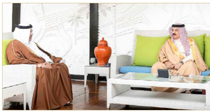
جلالة الملك يستقبل سمو ولي العهد رئيس مجلس الوزراء

◆ جلالة الملك: المسيرة الظافرة لقوة الدفاع زاخرة بالإنجازات الكبيرة