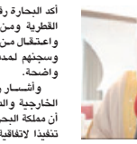
م. محمد السيسي

أكد المهندس محمد السيسي البوعيين رئيس لجنة الشؤون الخارجية والدفاع والأمن الوطني مجلس النواب، أن قطر مازالت تتعدت التزاماتها للجهود والمبادرات الخيرة من مملكة البحرين لوقف سلسلة الانتهاكات والاعتداءات المستمرة التي تعارفاها السلطات القطرية بحق البحارة البحرانيين داخل الحدود البحرية البحرينية، مشيراً إلى أنها تلك مصررة على مخالفة مخرجات قمة العلا بمملكة العربية السعودية التي تدعو إلى المحلة الخيرية. خلال ندوة الانتهاكات الخيرية بحق البحارة البحرين التي أقيمتها جمعية قلاب الصيادين بالتعاون مع عدد من الجمعيات الخيرية أمس، والتي تناولت الانتهاكات القطرية بحق