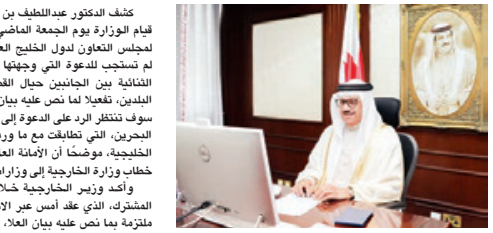
○ وزير الخارجية.

كشفت الدكتورة عبداللطيف بن راشد الزباني وزير الخارجية في بيان للوزارة يوم الجمعة الماضي بإرسال خطاب إلى الأمين العام لمجلس التعاون لدول الخليج العربية، أوضحت فيه أن دولة قطر لم تستجب للدعوة التي وجهتها وزارة الخارجية لبدء المحادثات الثنائية بين الجانبين حيال القضايا والموضوعات المتعلقة بين البلدين، تفصيلاً لما نص عليه بيان العلا، وأنه تم تأكيد أن البحرين سوف تنتظر الرد على الدعوة إلى اللقاء الثنائي، الذي هو رغبة أهل البحرين، التي تطالب مع ما ورد في بيان العلا الصادر عن القمة الخليجية، موضحاً أن الأمانة العامة لمجلس التعاون بتعليم خطاب وزارة الخارجية إلى وزارات الخارجية في الدول الأعضاء. وأكد وزير الخارجية خلال الاجتماع البرلماني الحكومي المشترك الذي عقد أمس عبر الاتصال المرئي، أن مملكة البحرين ملتزمة بما نص عليه بيان العلا، وهي على استعداد لبدء محادثات جادة ثنائية مع قطر لمعالجة كل القضايا والموضوعات العالقة.